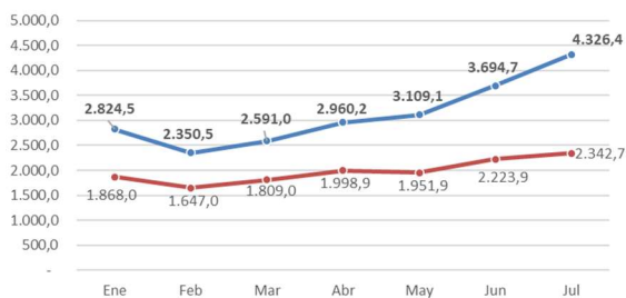
Serie de recaudación mensual 2022 y 2021

Por último, analizando los primeros 7 meses del año, la recaudación acumula un crecimiento del 57,9%. Los ingresos tributarios junto a los fondos apuntalaron este crecimiento, mientras que los ingresos por tasas y regalías crecieron, pero a menor ritmo. Por el contrario, los Derechos Hidrocarburíferos se redujeron un 42,3%, moderando el crecimiento total.