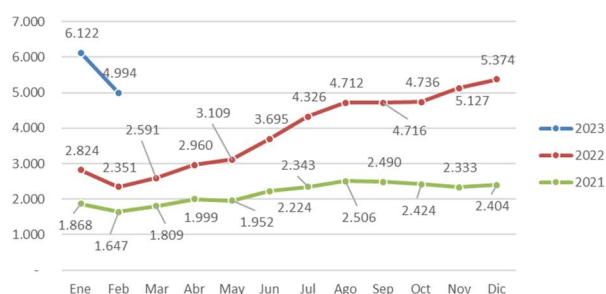
Serie de recaudación mensual 2021-2022-2023

Por último, analizando el acumulado de enero - febrero, la recaudación acumula un crecimiento del 114,5%. Los ingresos tributarios junto a los fondos apuntalaron este crecimiento, mientras que los ingresos por tasas y regalías crecieron, pero a menor ritmo. Los Derechos Hidrocarburíferos acompañaron con un crecimiento de 94,6%,