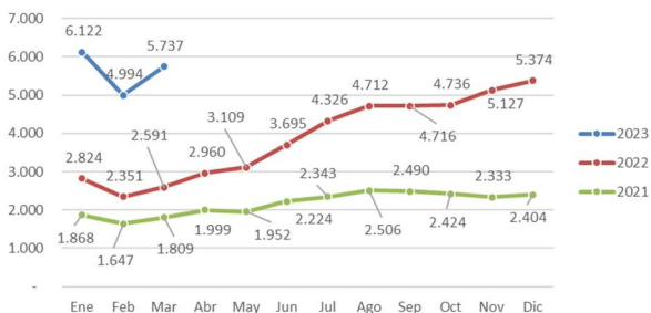
Serie de recaudación mensual 2021-2022-2023

Por último, analizando el acumulado de enero - marzo, la recaudación acumula un crecimiento del 117,1%. Los ingresos tributarios junto a los fondos apuntalaron este crecimiento, mientras que los ingresos por tasas y regalías crecieron, pero a menor ritmo. Los Derechos Hidrocarburíferos acompañaron con un crecimiento de 87,6%,