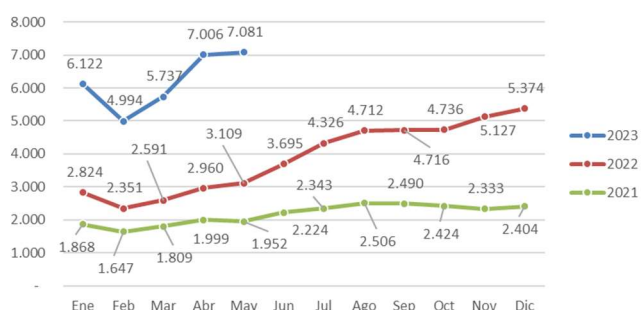
Serie de recaudación mensual 2021-2022-2023

Por último, analizando el acumulado de enero - mayo, la recaudación acumula un crecimiento del 123,4%. Los ingresos tributarios junto a los fondos apuntalaron este crecimiento, mientras que los ingresos por tasas y regalías crecieron, pero a menor ritmo. Los Derechos Hidrocarburíferos acompañaron con un crecimiento de 75,3%,