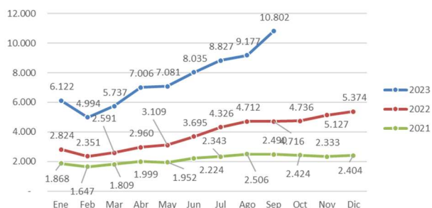
Serie de recaudación mensual 2021-2022-2023

Por último, analizando el acumulado de enero - septiembre, la recaudación acumula un crecimiento del 116,6%. Los ingresos tributarios junto a los fondos y tasas apuntalaron este crecimiento, mientras que los ingresos por regalías y derechos crecieron, pero a menor ritmo.