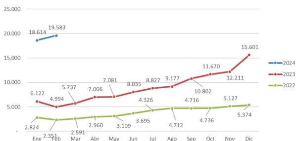
Serie de recaudación mensual 2022-2023-2024

Por último, analizando el acumulado de enero - febrero, la recaudación acumula un crecimiento del 243,0%. Los ingresos tributarios junto a los fondos y Derechos Hidrocarburíferos apuntalaron este crecimiento, mientras que los ingresos por regalías y tasas crecieron, pero a menor ritmo.