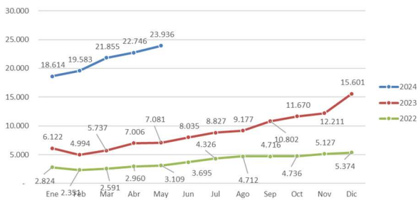
Serie de recaudación mensual 2022-2023-2024

Por último, analizando el acumulado de enero - mayo, la recaudación acumula un crecimiento del 244,9%. Los ingresos tributarios junto a los fondos, regalías y derechos hidrocarburíferos apuntalaron este crecimiento, mientras que los ingresos por tasas crecieron, pero a menor ritmo.