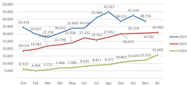
Serie de recaudación mensual 2023-2024-2025

Por último, analizando el acumulado de enero - noviembre, la recaudación acumula un crecimiento del 42,3%. Los ingresos tributarios y otros derechos apuntalaron este crecimiento, mientras que los ingresos por tasas y fondos crecieron, pero a menor ritmo. En contra partida, las regalías presentan una leve baja.